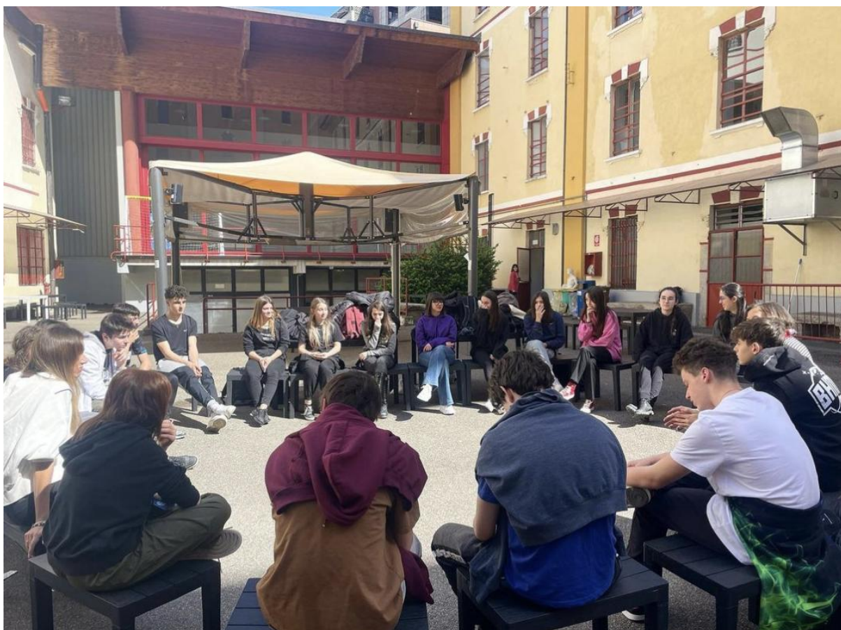
Benessere emotivo e inclusione: pratiche di Mindfulness all'aperto per gli Studenti del Casnati nel piazzale del Centro Studi.